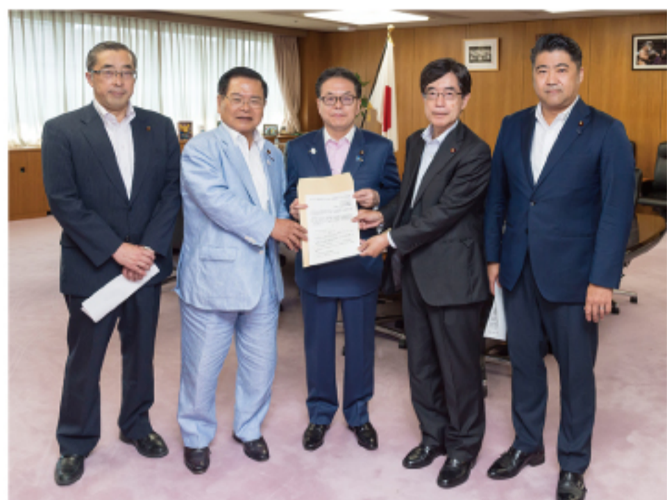
▲経済産業大臣に緊急要望