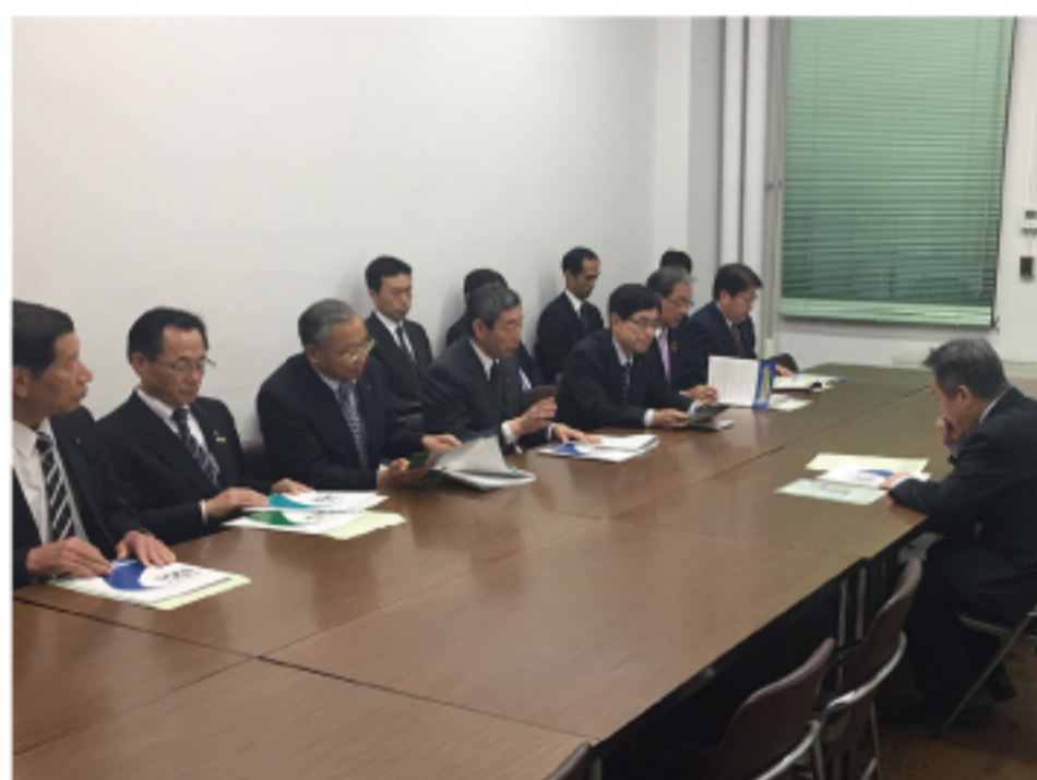
▲地元市長と財政当局に要望活動