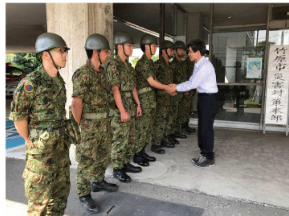
▲支援活動の自衛隊の方々を激励