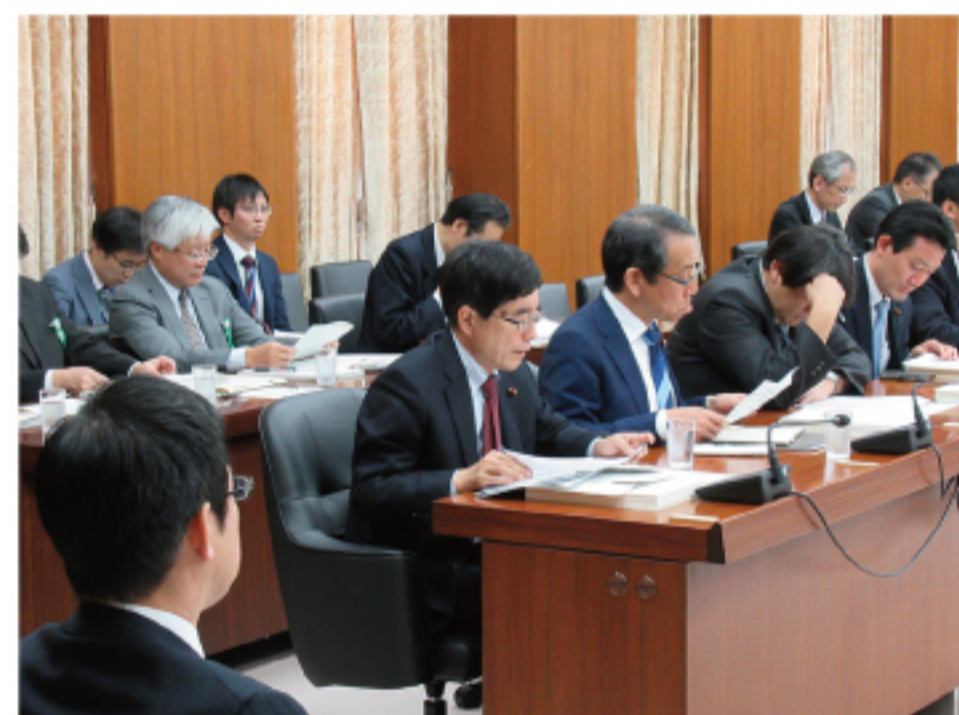
▲衆議院財務金融委員会与党筆頭理事として