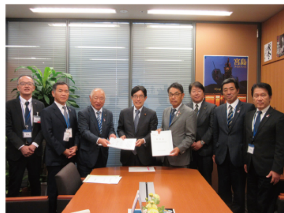
▲被災地支援策要望受け