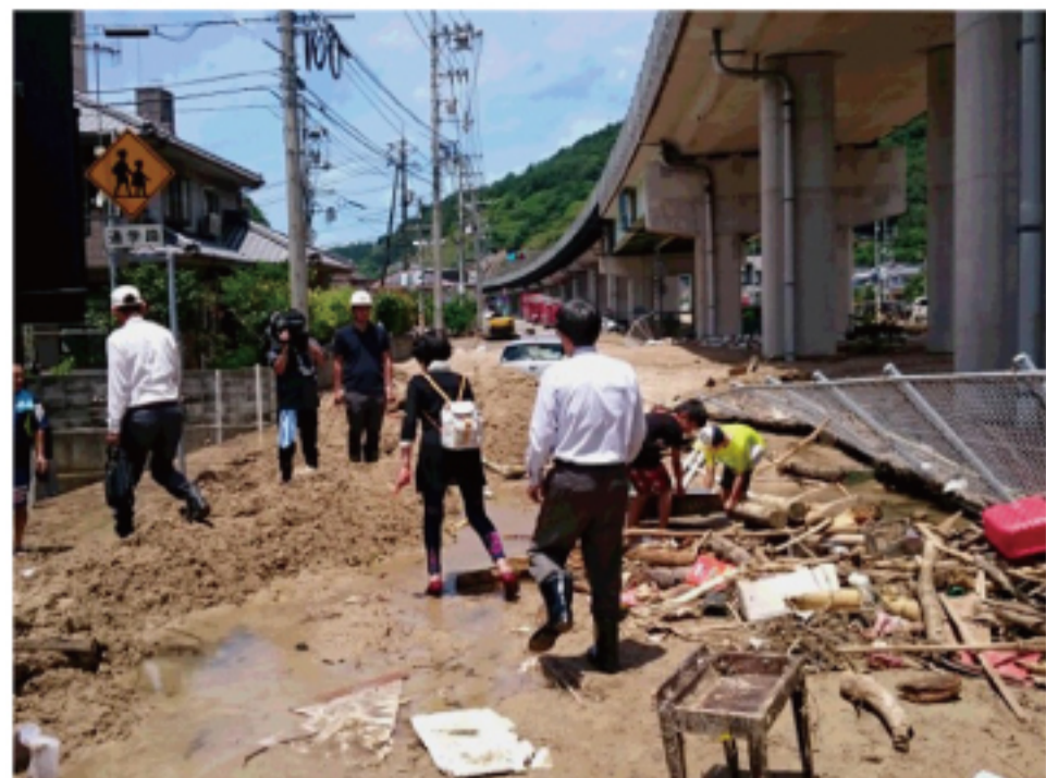
▲豪雨災害後の被害状況視察