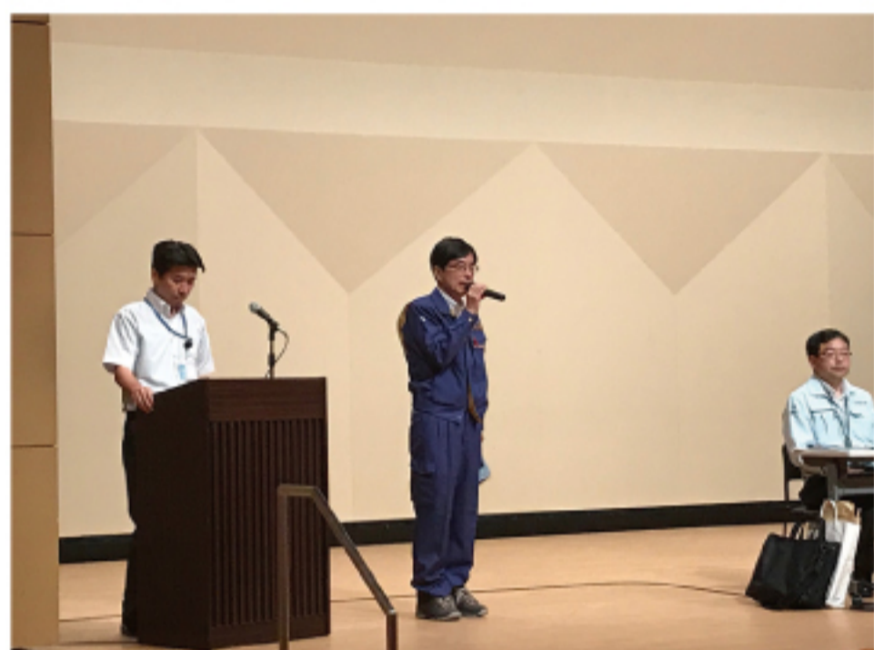
▲被災地企業支援策説明会